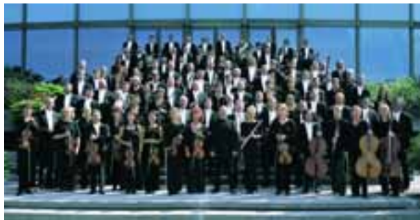
Bruckner Orchester Linz