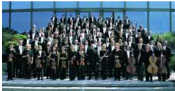
Bruckner Orchester Linz