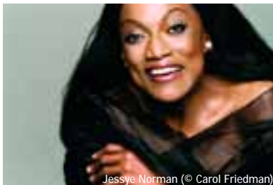
Jessye Norman